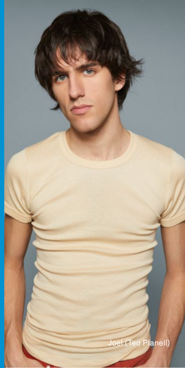
Joel (Teo Planell)

Una coproducción de Nave 10 | Matadero y Producciones Come y Calla